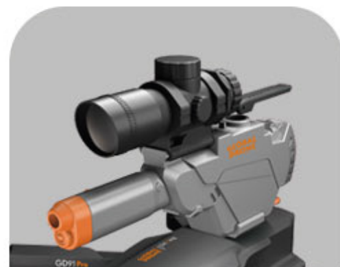
Fucile ad acqua